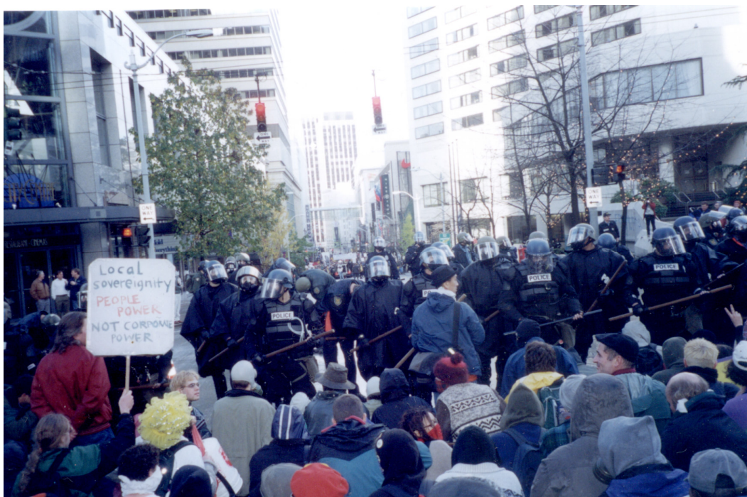
Manifestantes confrontam policiais nas ruas de Seattle, em 1999.