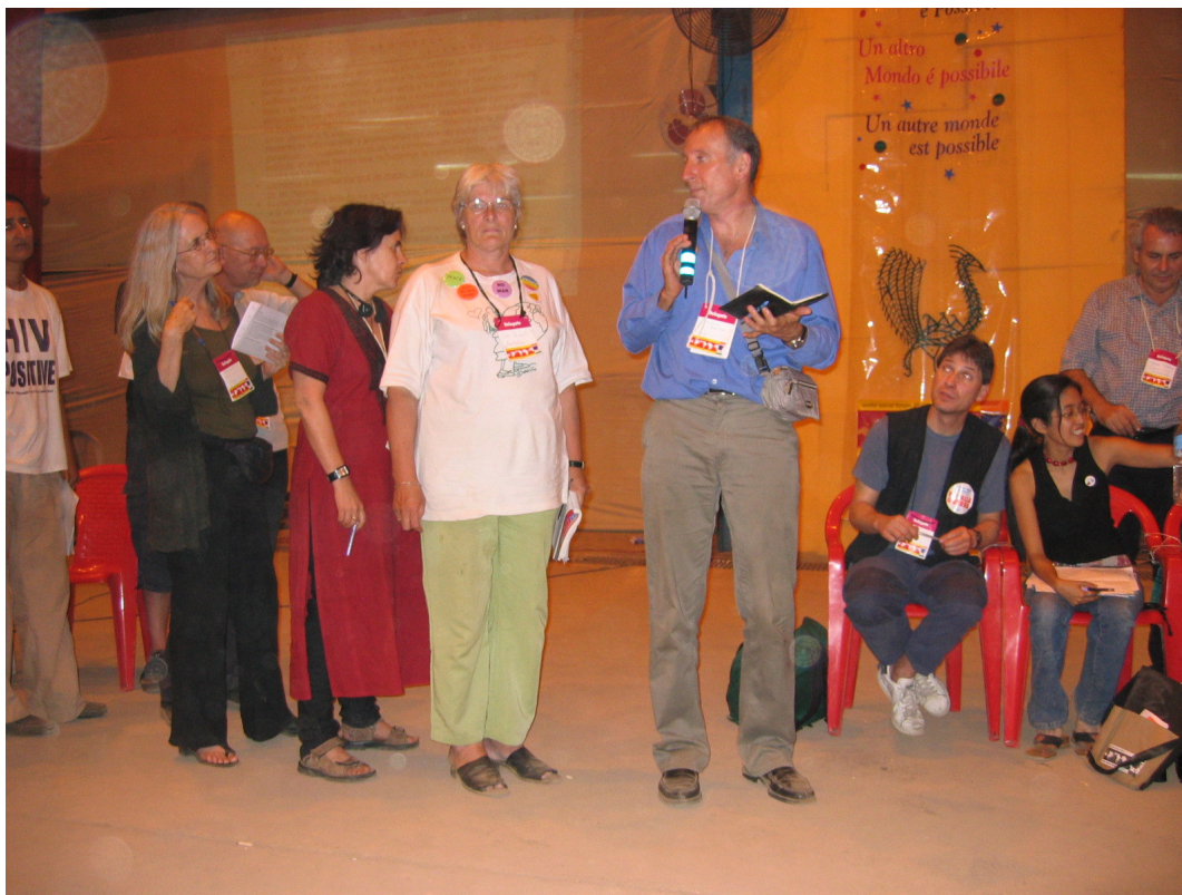
Participantes da Assembléia dos Movimentos Sociais debatem no FSM 2004 de Mumbai.