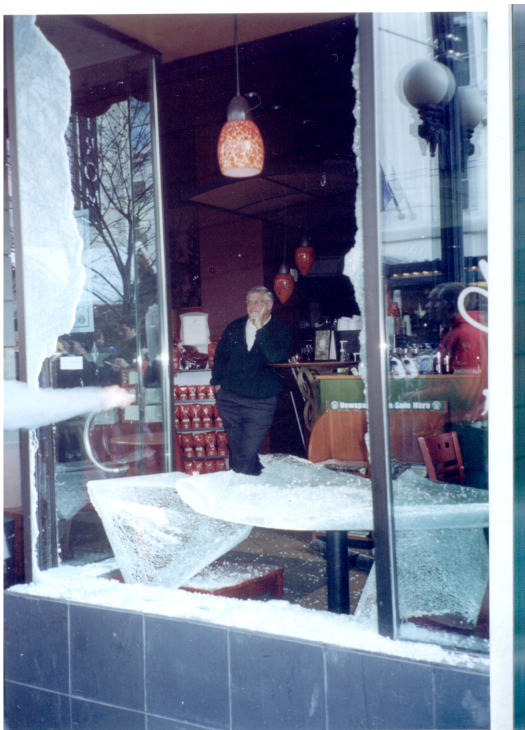
Funcionário da rede mundial de cafeterias Starbucks observa vitrine destruída durante os protestos contra a OMC de Seattle, em 1999.

ANEXO A – Fotos ilustrativas de protestos antiglobalização e de seus fóruns. As fotos estão organizadas em ordem cronológica, de Seattle 1999 a Nairobi 2007. Inúmeras outras estão facilmente disponíveis através de busca na Internet 114 .