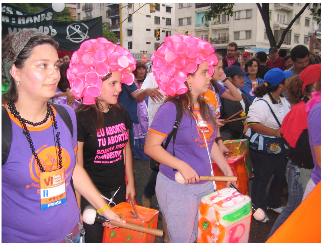
Feministas da Marcha Mundial das Mulheres durante passeata no FSM 2006 de Caracas, Venezuela.