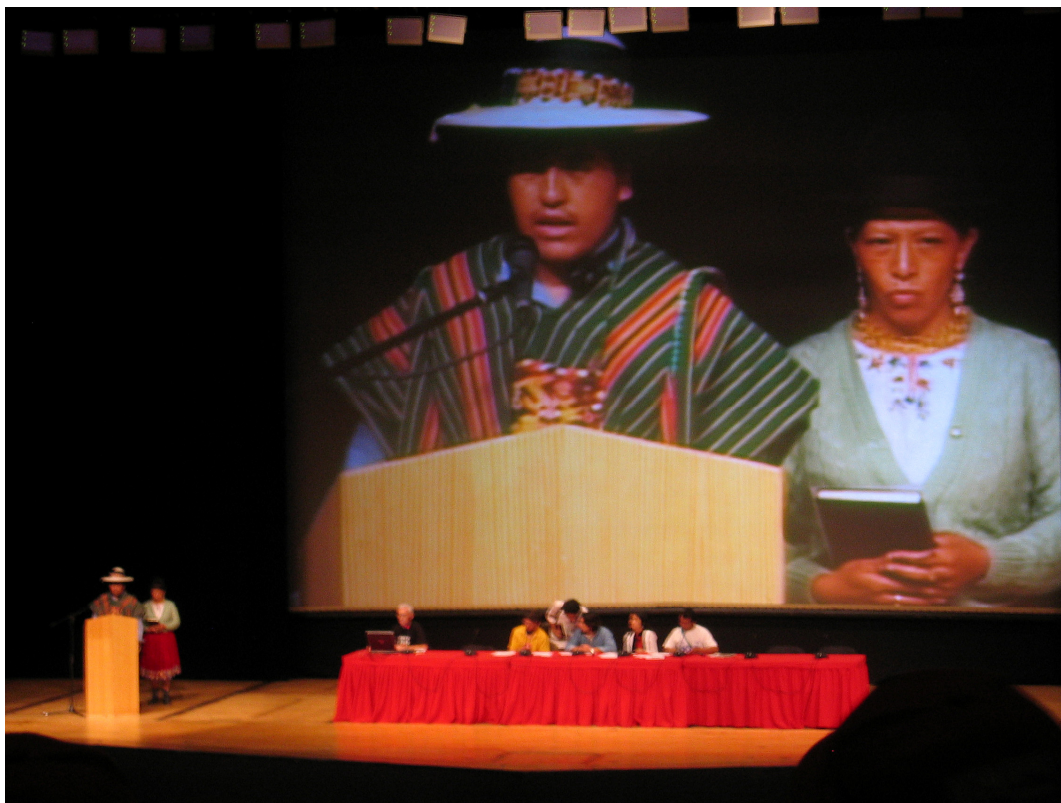
Indígenas discursam na Assembléia dos Movimentos Sociais em Caracas, 2006.