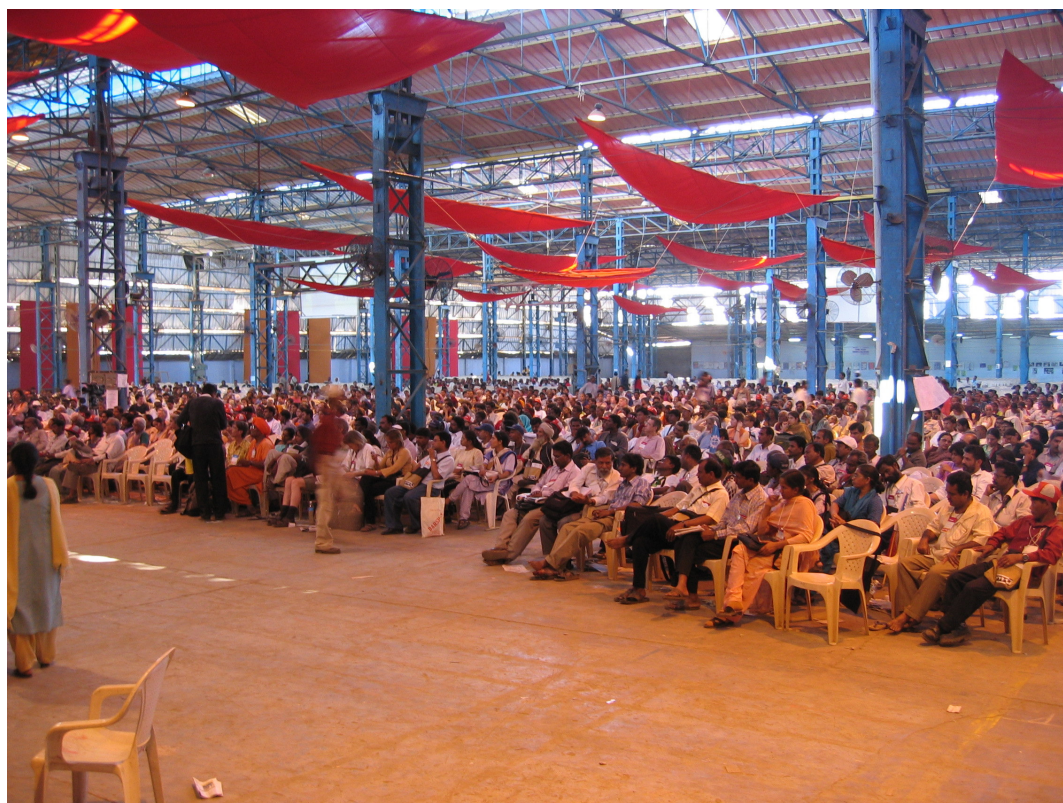
Participantes em Conferência do FSM 2004 de Mumbai, Índia.