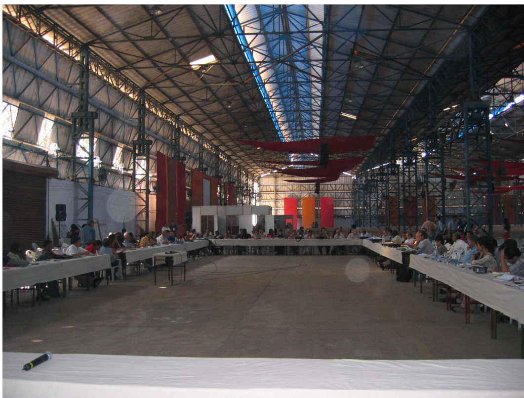
Reunião do Conselho Internacional do Fórum Social Mundial 2004 em Mumbai, Índia.