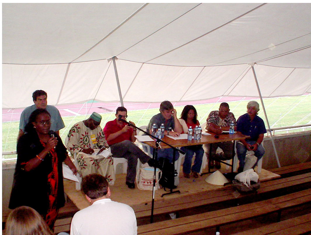
Participantes debatem em oficina durante o FSM 2007 de Nairobi.