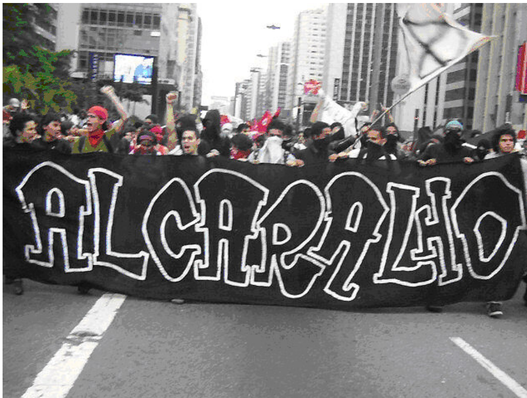
Manifestação antiglobalização contra a ALCA, em São Paulo, abril de 2002 116 .