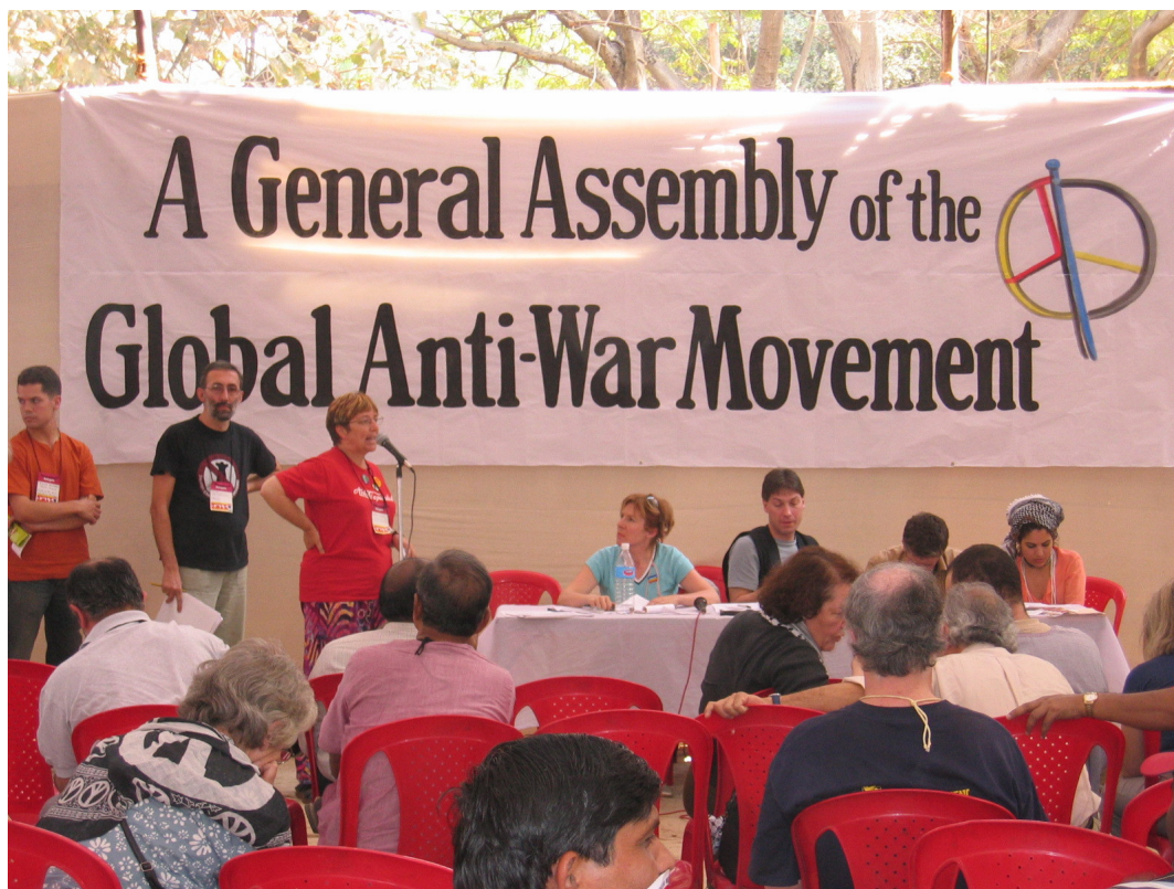
Ativistas se reúnem na Assembléia Geral Contra a Guerra do Iraque, no FSM 2004 de Mumbai, Índia.