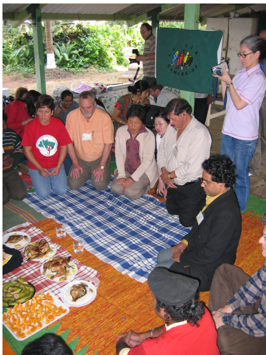
Camponeses da Via Campesina fazem ritual com alimentos antes de iniciar reunião, no FSM 2004 de Mumbai, Índia.