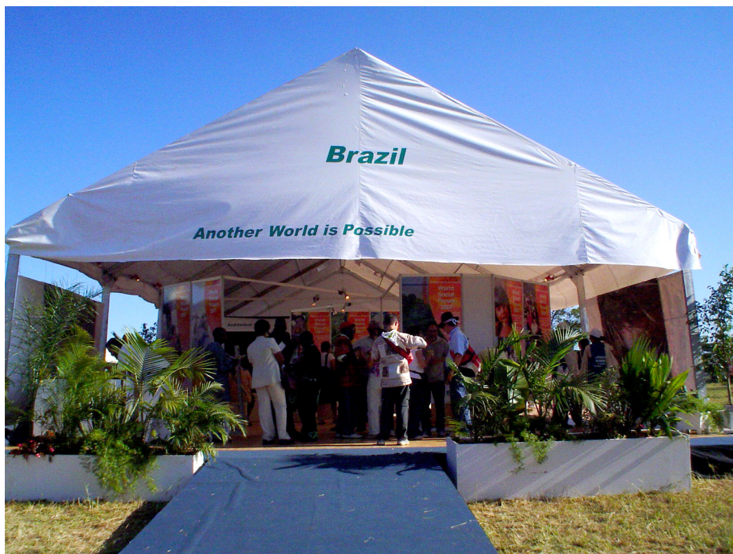
Tenda do governo brasileiro no Fórum Social Mundial 2007 de Nairobi.