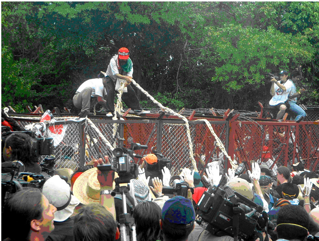
Manifestantes coreanos preparam-se para derrubar as cercas colocadas pela polícia durante os protestos contra a OMC em Cancun.