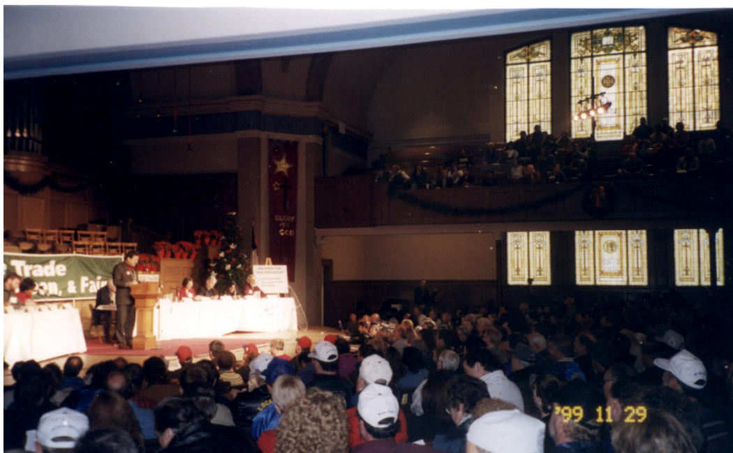
Manifestantes realizam debate em Igreja de Seattle, dias antes dos protestos contra a OMC.