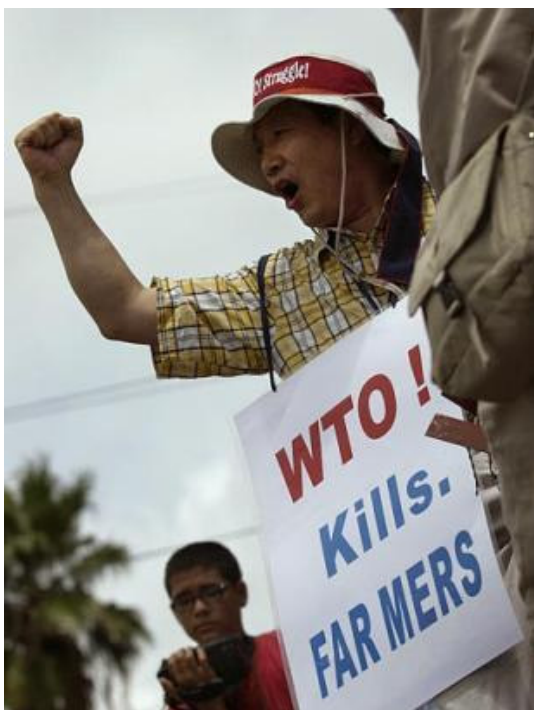
O camponês coreano Lee Kyung Hae protesta contra a OMC em Cancun, em 2003, momentos antes de se suicidar levando os dizeres: “a OMC mata camponeses” 118 .