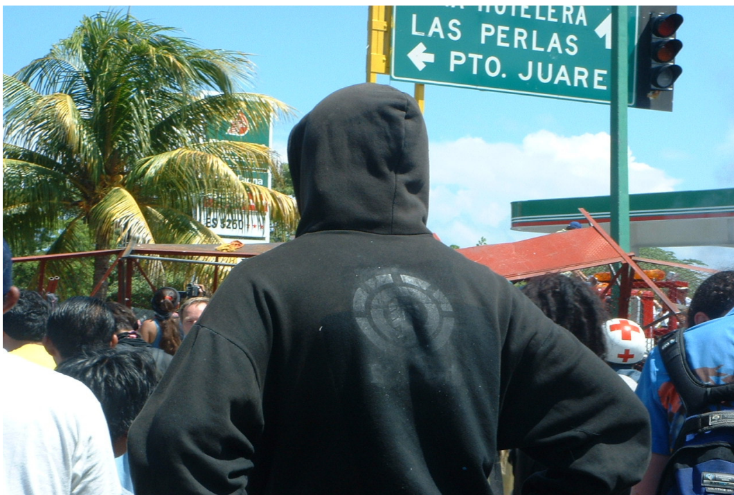
Membro do Black Block durante protesto contra a OMC em Cancun, 2003.