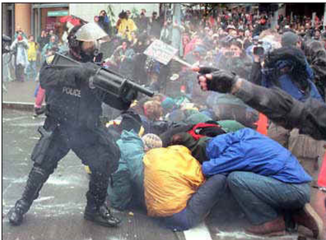
Policial atira contra manifestantes em Seattle 115 .